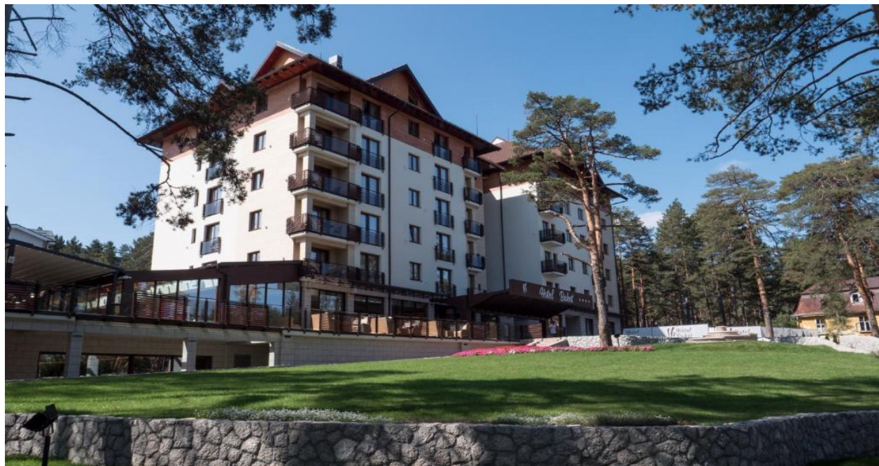
Hotel “Buket” Zlatibor